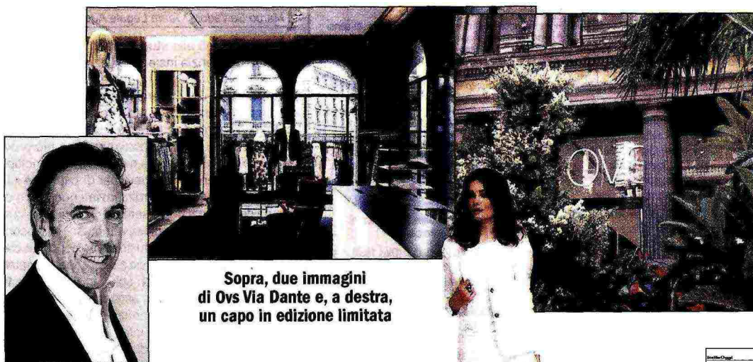
Sopra, due immagini di Ovs Via Dante e, a destra, un capo in edizione limitata