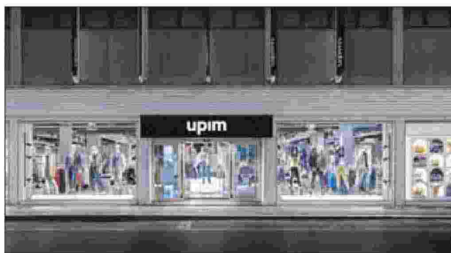
Il nuovo grande magazzino Upim in via Marghera a Milano. A destra, lo spazio per la casa a marchio Croff