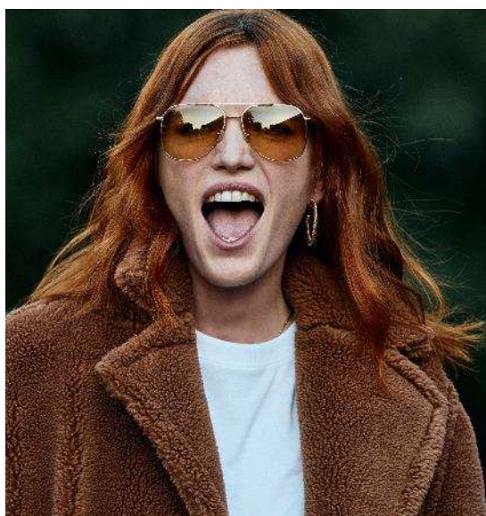
Nuova collezione Piombo Donna