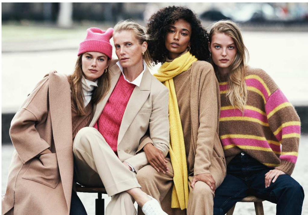
Nuova collezione Stefanel

Nota: ai fini di dare una rappresentazione più chiara dell'andamento del Gruppo i valori contenuti nel documento sono rettificati. In particolare, i valori economici e patrimoniali rettificati escludono gli effetti contabili derivanti dal principio IFRS16. Si veda di seguito per ulteriori informazioni.